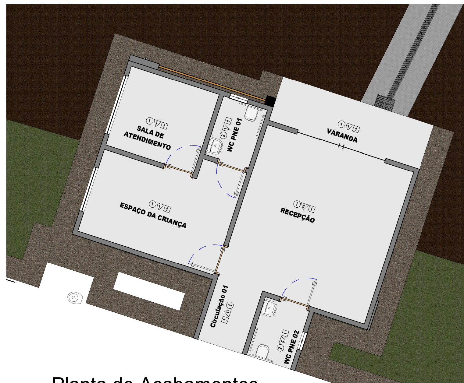
4 Planta de Acabamentos. 1 : 75