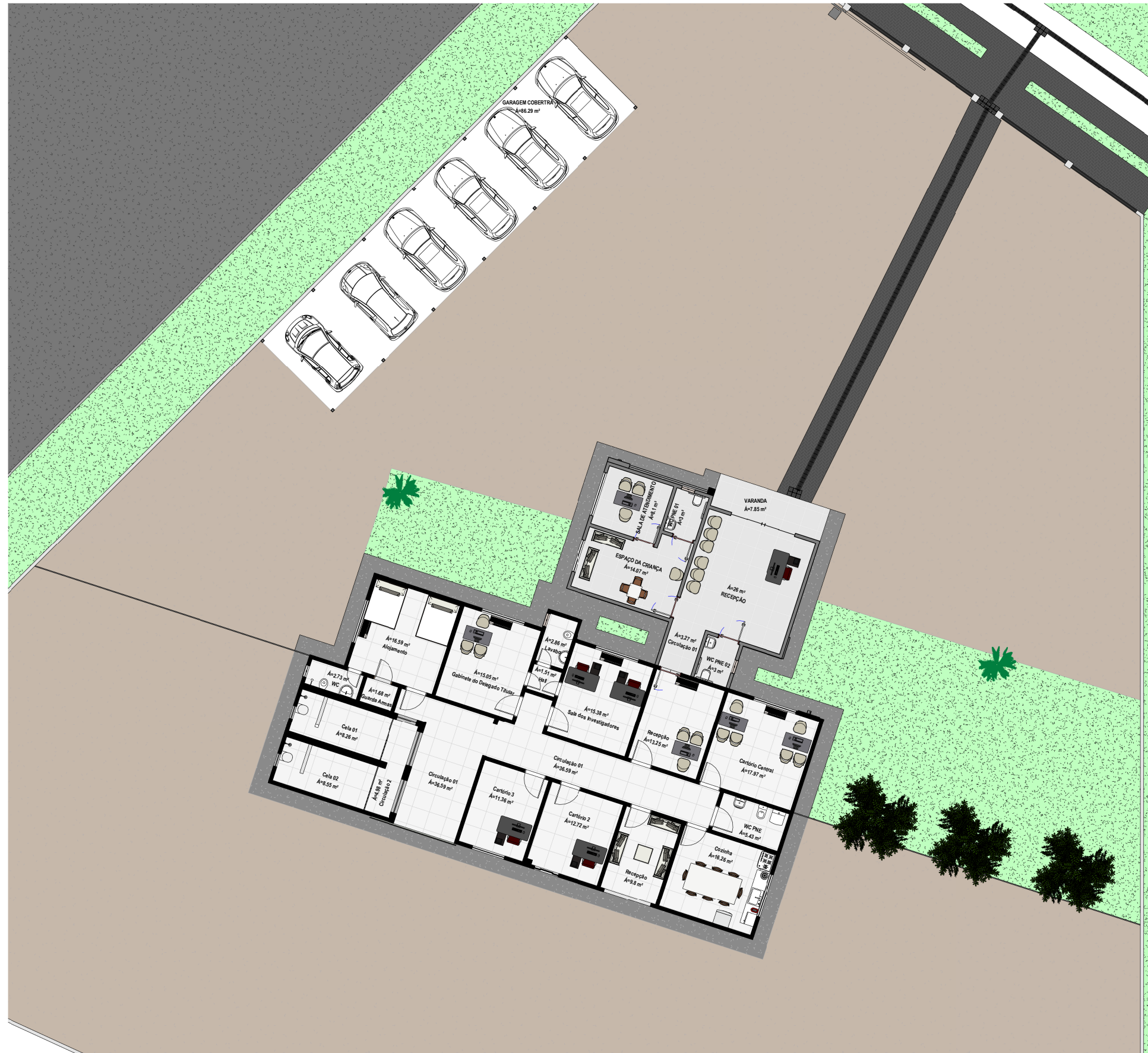
3 Planta Layout. 1 : 200